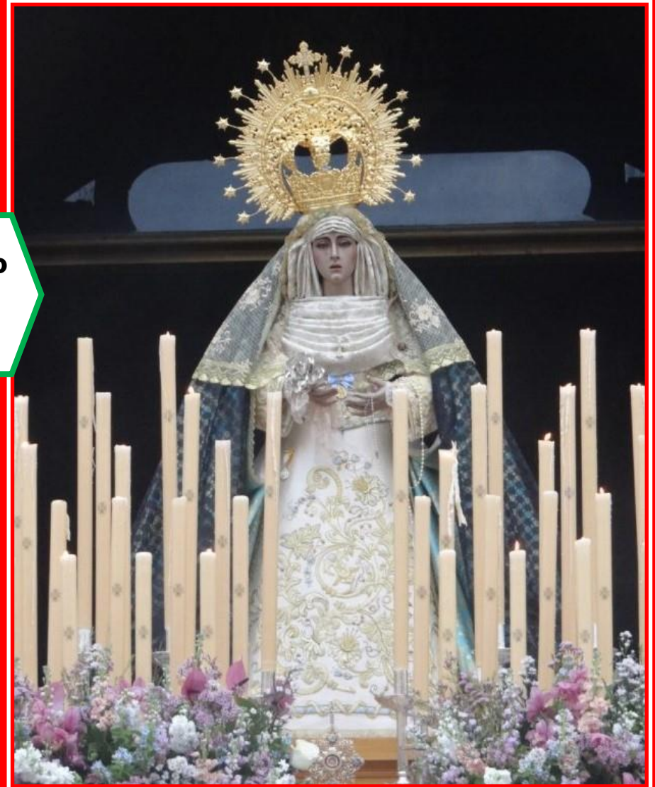
NTRA. SRA. DE LA SALUD Y DEL PERPETÚO SOCORRO