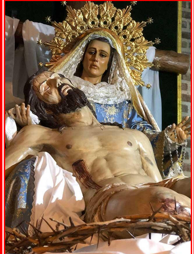
PASO DE LA VIRGEN DE LAS ANGUSTIAS