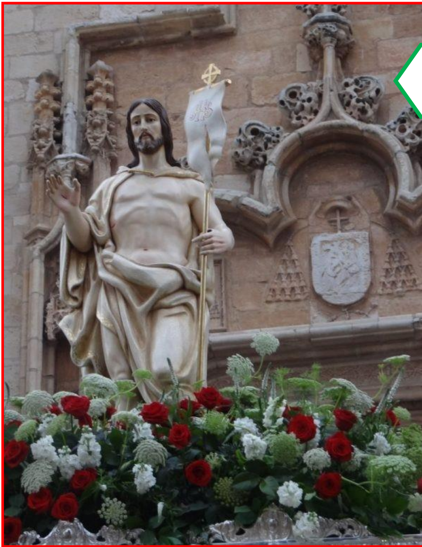
NTRO. PADRE JESÚS RESUCITADO