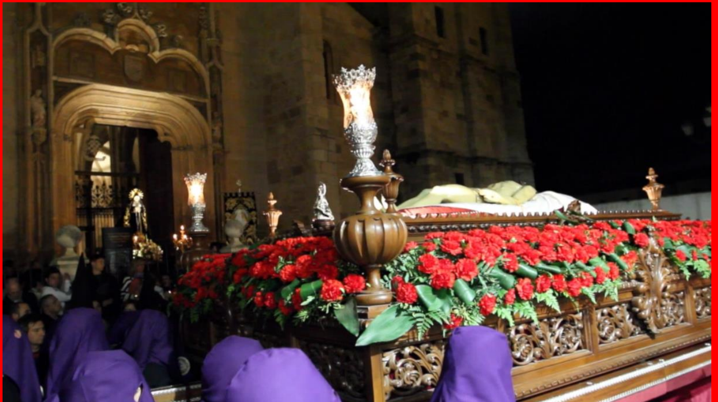
XIV ESTACIÓN JESUS ES SEPULTADO (IMAGEN DEL CRISTO YACENTE)