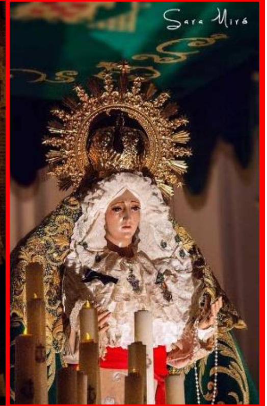
NUESTRA SEÑORA DE LA ESPERANZA