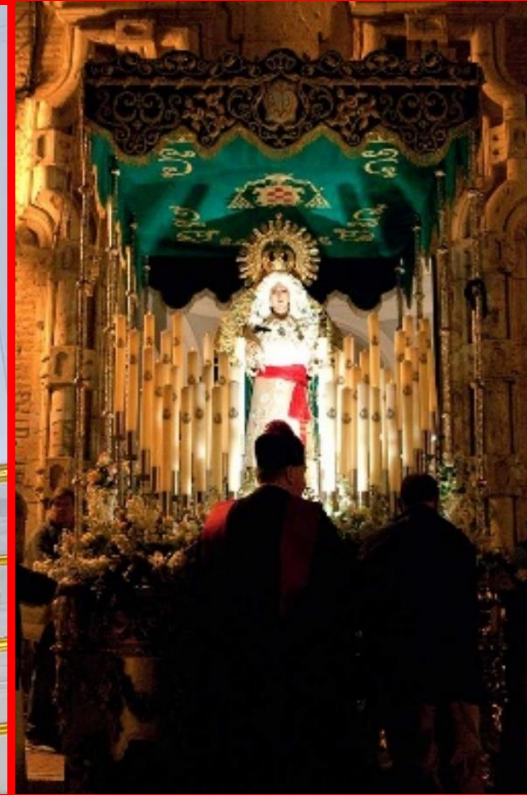
NUESTRA SEÑORA DE LA ESPERANZA "BAJO PALIO"