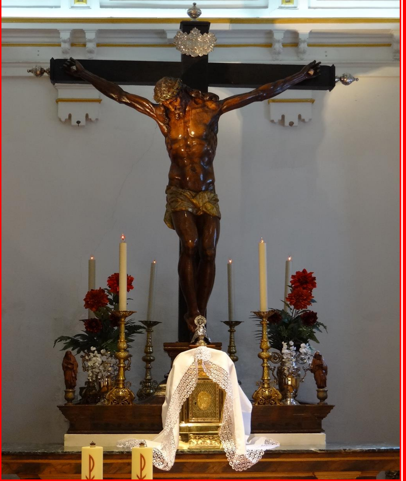
XII ESTACIÓN JESÚS MUERE EN LA CRUS (CRISTO DE LOS DOCTRINOS)