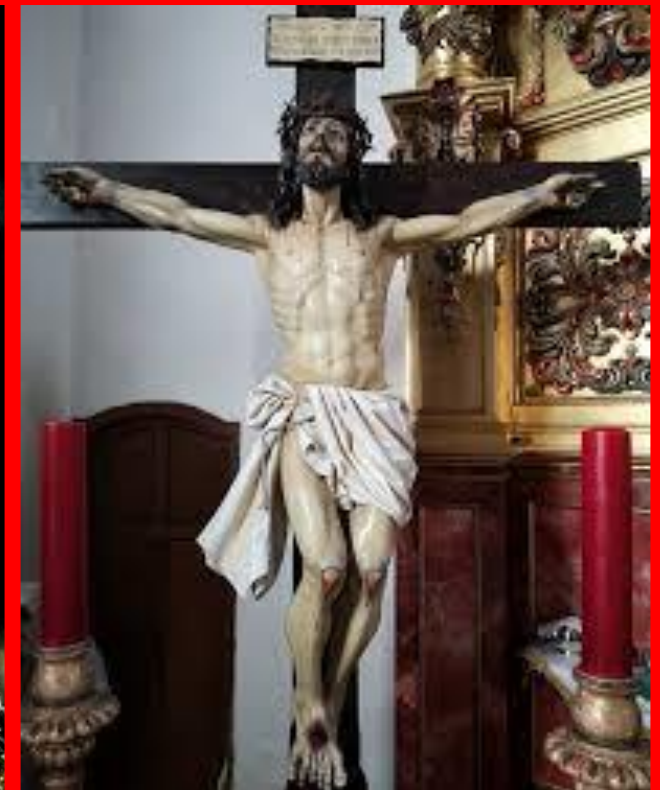
STMO. CRISTO DE LA AGONÍA