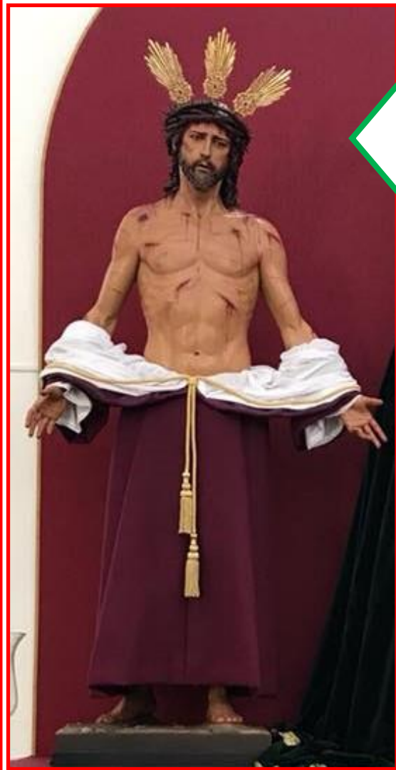
JESÚS DESPOJADO DE SUS VESTIDURAS