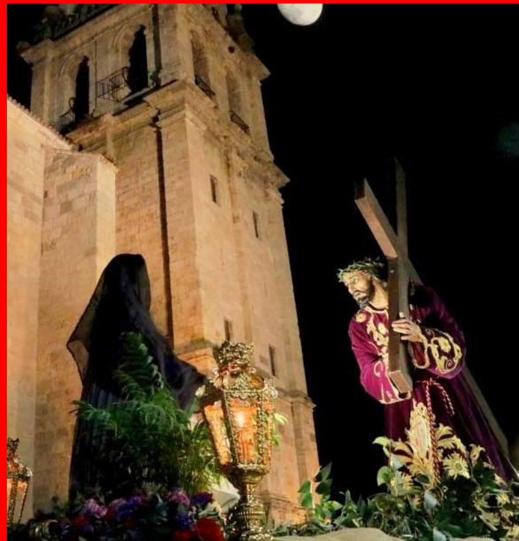
PASO DE MISTERIO