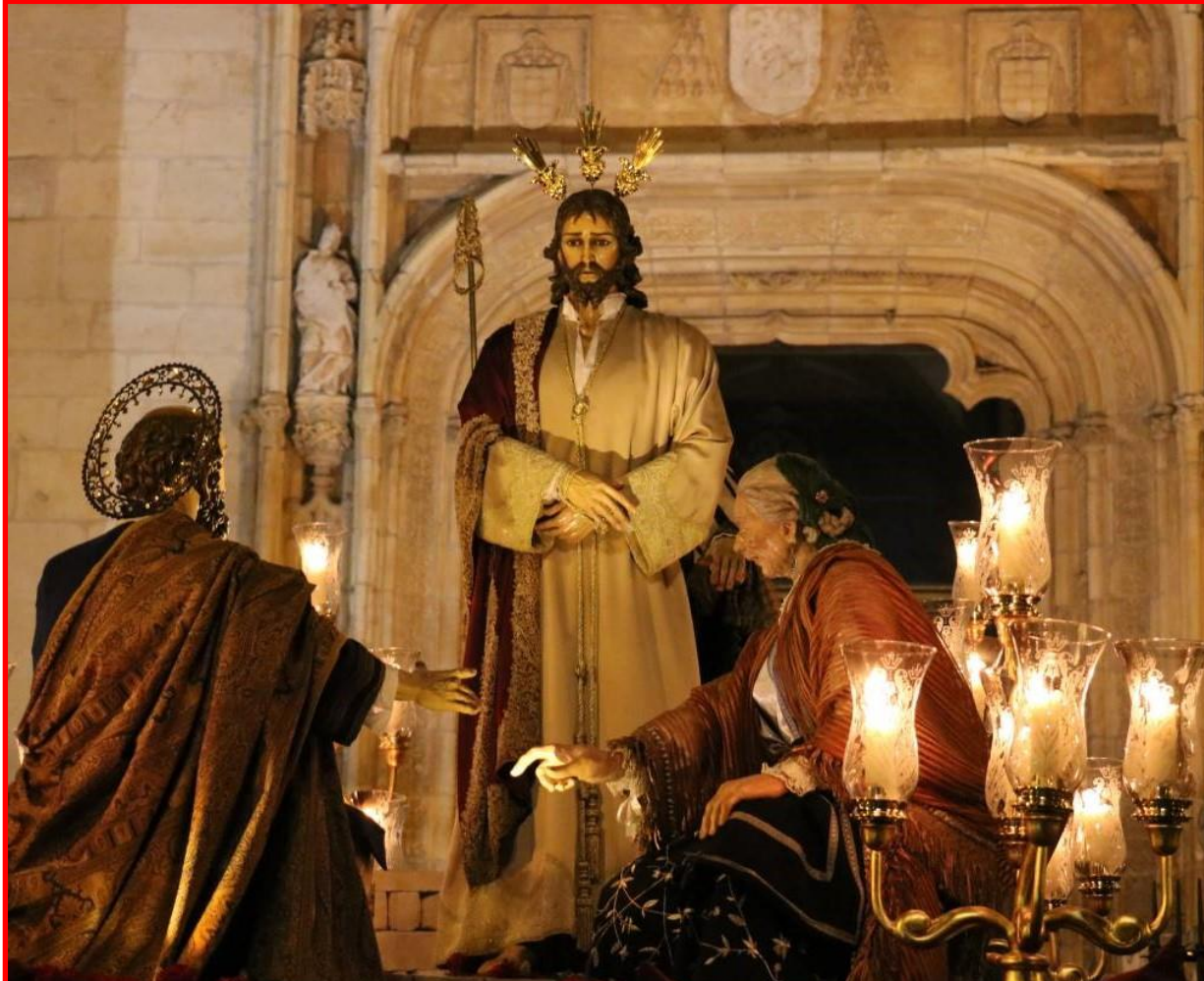
PASO DE LAS NEGACIONES DE SAN PEDRO