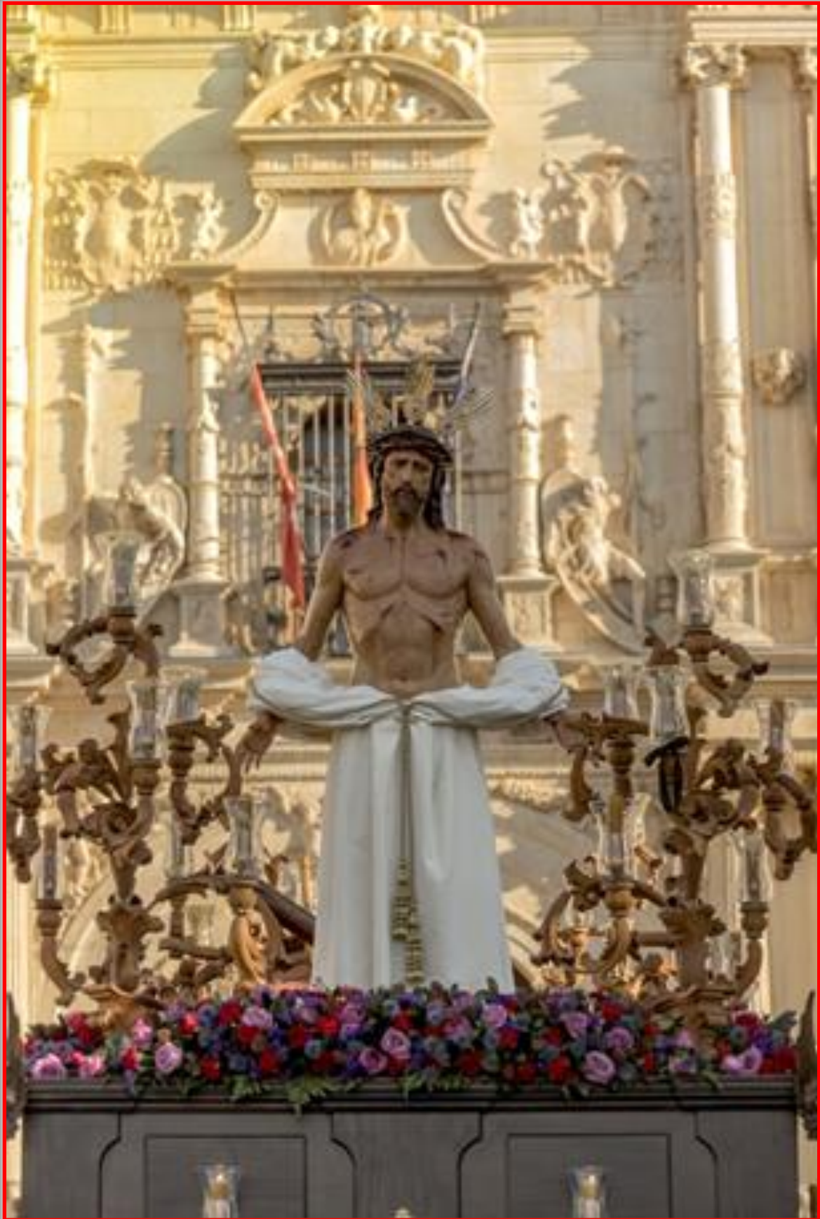
X ESTACIÓN JESÚS DESPOJADO DE LAS VESTIDURAS (IMAGEN DEL PASO DEL MISTERIO)