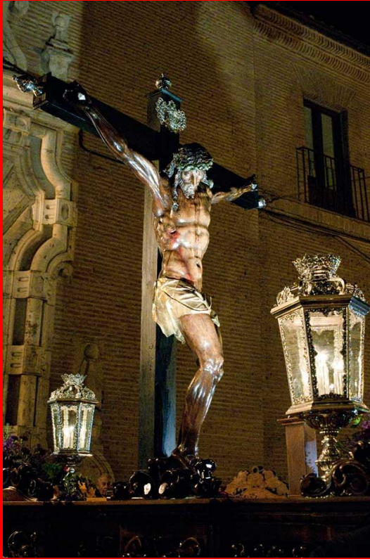
PASO DE MISTERIO