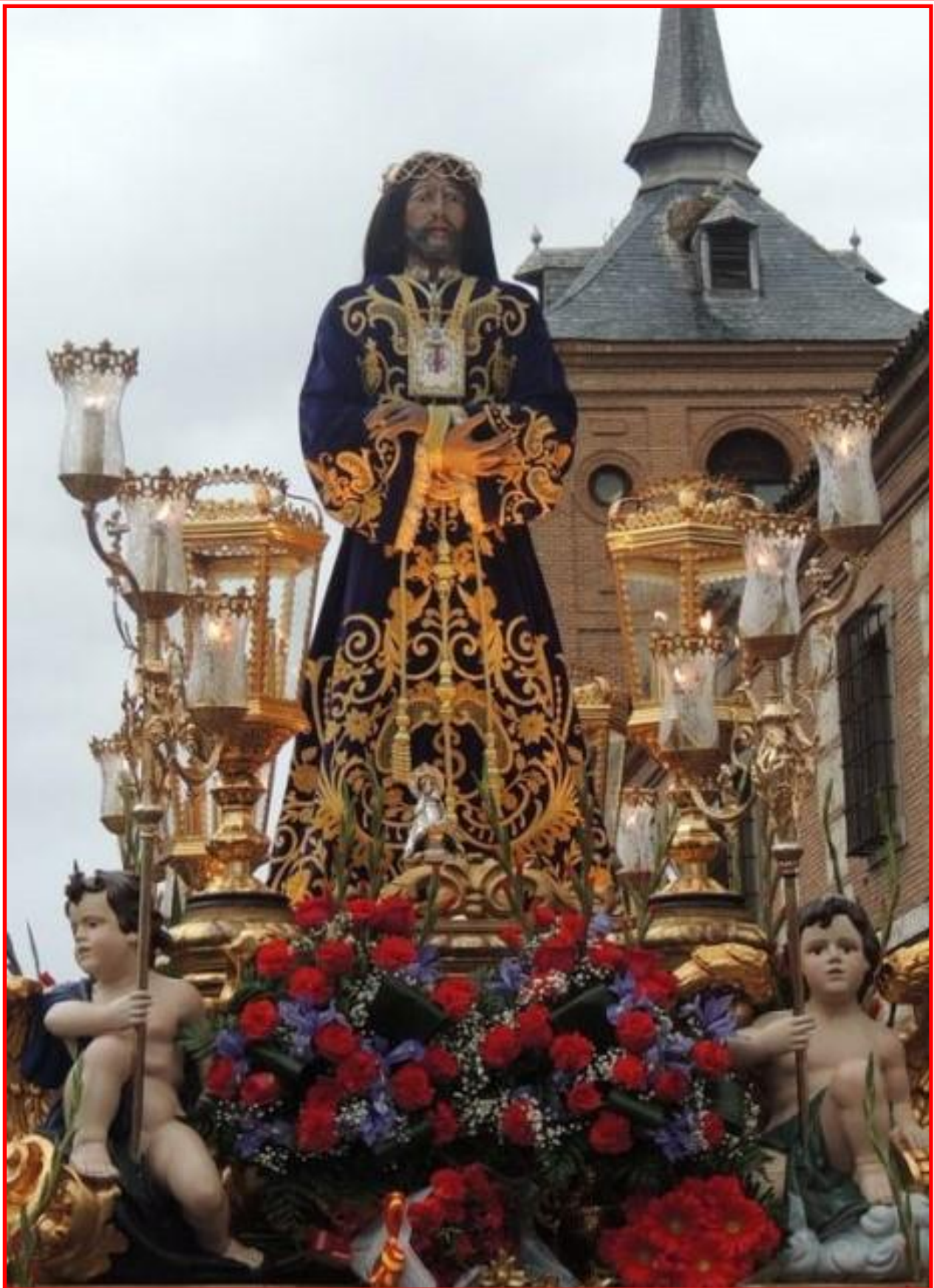
VII ESTACIÓN JESÚS CAE POR SEGUNDA VEZ (IMAGEN DEL PASO DE JESÚS DE MEDINACELI)