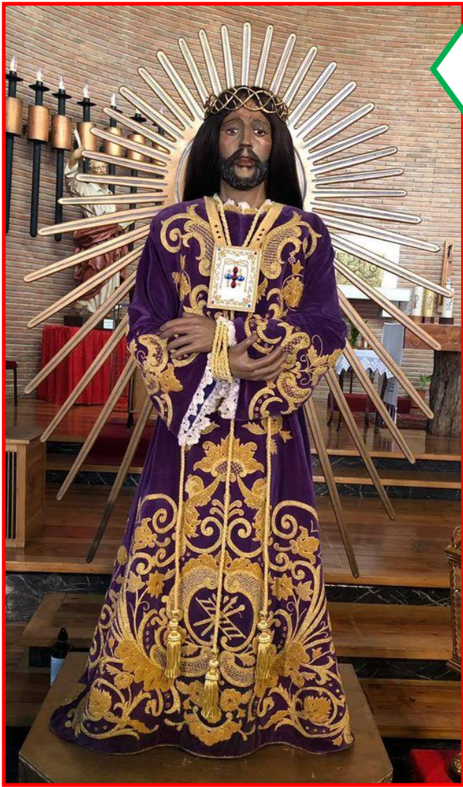
NUESTRO PADRE JESÚS DE MEDINACELI