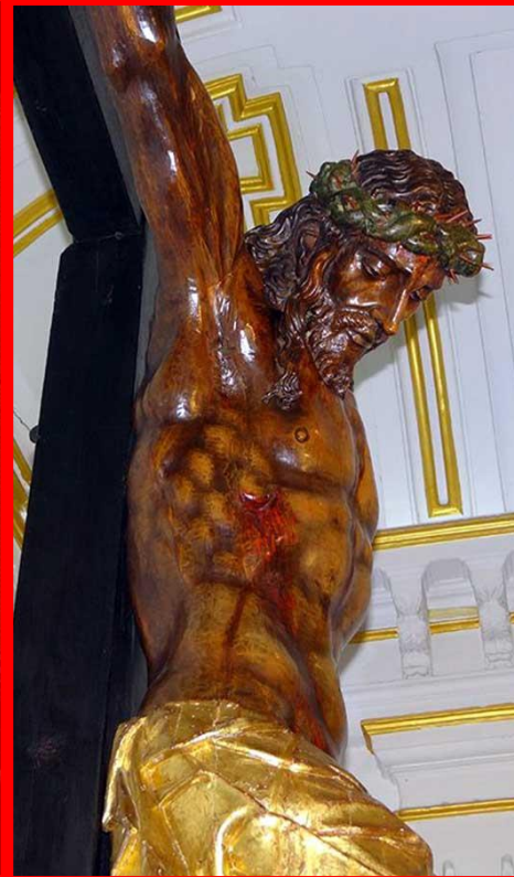
CRISTO UNIVERSITARIO DE LOS DOCTRINOS