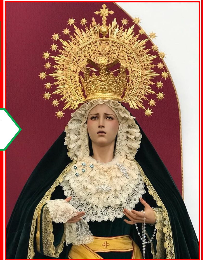
MARIA STMA. DE LA PAZ Y ESPERANZA