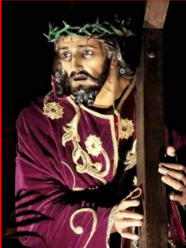
JESÚS CON LA CRUZ A CUESTAS