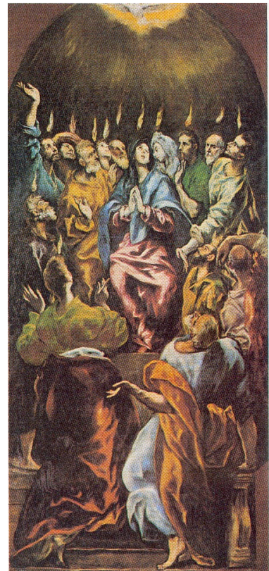
Pentecostés, El Greco Museo del Prado

El Papa San Juan Pablo II escribió una carta apostólica dedicada al domingo, “ Dies Domini ”.